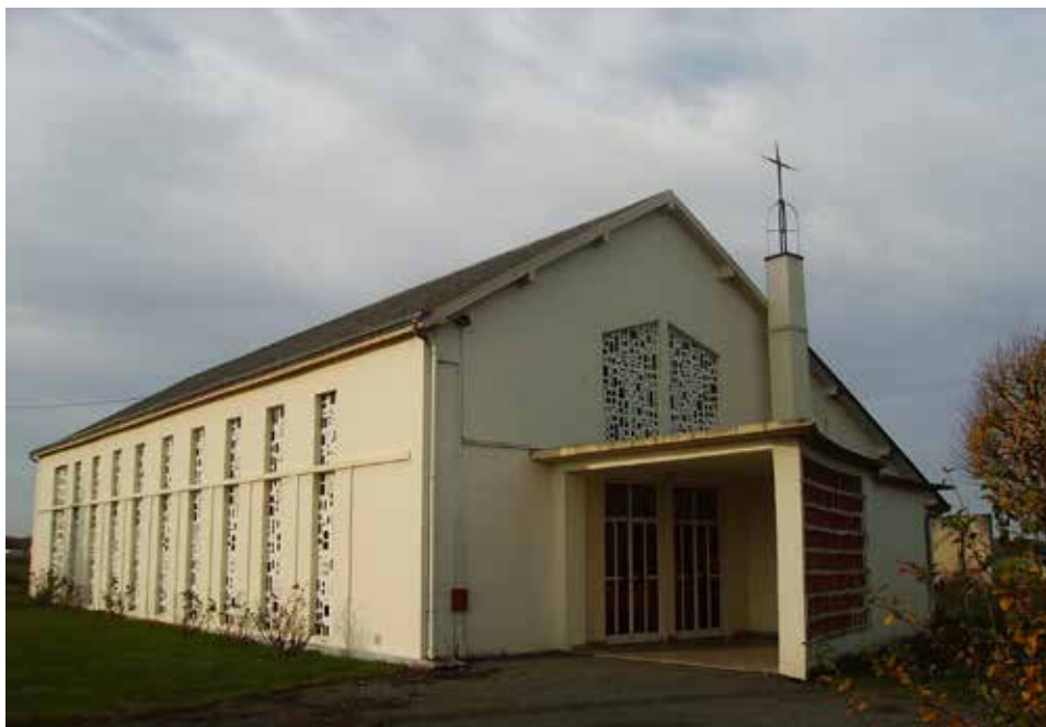
L'église Sté-Thérèse aujourd'hui

Confrontée à des difficultés à la fois pastorales et financières, la paroisse s'est résolue à vendre l'église Sainte Thérèse, dans le quartier Prod'homme. La mairie de Dreux s'est montrée intéressée et prévoit de la détruire afin de construire des logements à la place.