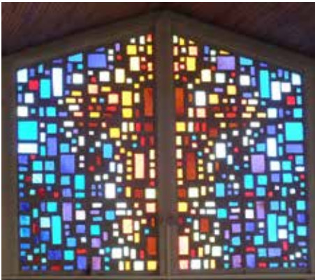
Vitrail église Ste-Thérèse