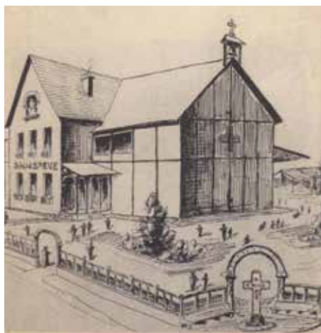
Projets de 1933 - La Salle Ste-Ève

Confrontée à des difficultés à la fois pastorales et financières, la paroisse s'est résolue à vendre l'église Sainte Thérèse, dans le quartier Prod'homme. La mairie de Dreux s'est montrée intéressée et prévoit de la détruire afin de construire des logements à la place.