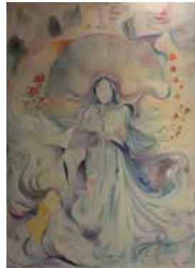
À ste-Thérèse et aux femmes du monde entier